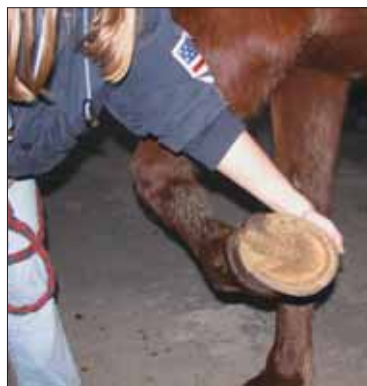
Fig. 17 ~ Come si solleva un arto