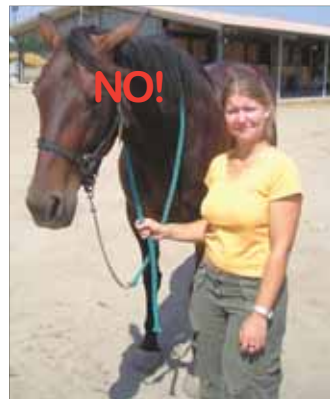
Figg. 9 - 12 ~ come NON deve essere tenuta la lunghina