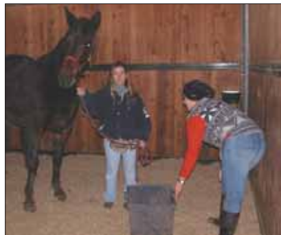
Fig. 16 ~ Distribuzione della razione direttamente nel box