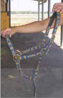
Fig. 2 ~ Cavezza