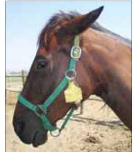
Fig. 5 ~ Come si presenta la cavezza al termine delle operazioni