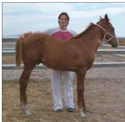
Fig. 25 ~ Come si tiene il puledro