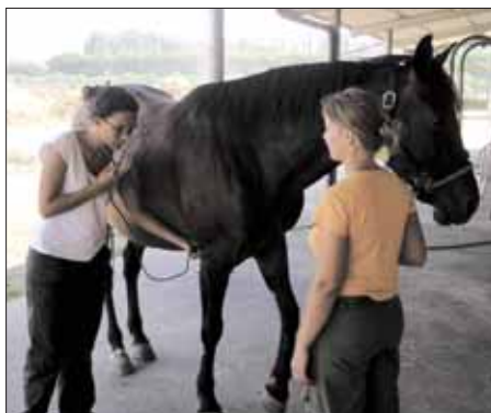
Fig. 18 ~ Visita clinica