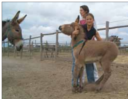
Fig. 24 ~ La fattrice è posta di fronte al puledro