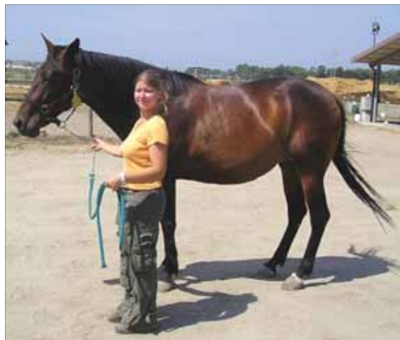
Fig. 6 ~ Come si aggancia la lunghina