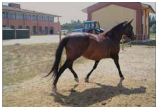
Fig. 1 ~ Cavallo in movimento