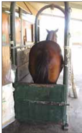
Fig. 22 ~ Chiudere il cancelletto posteriore