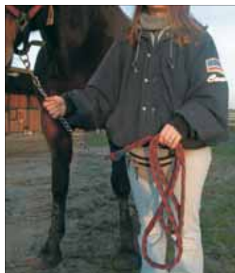
Fig. 8 ~ Come si tiene la parte eccedente della lunghina