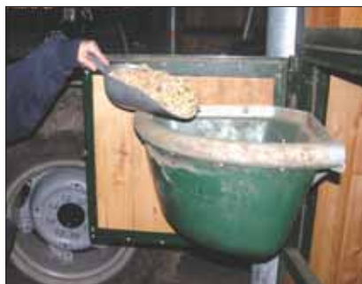
Fig. 15 ~ Caricamento del mangime direttamente nell'apposito contenitore