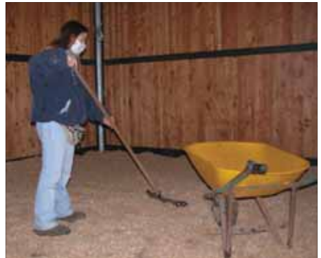
Fig. 14 ~ Rimozione della lettiera