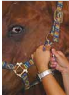
Fig. 4 ~ Moschettone della cavezza