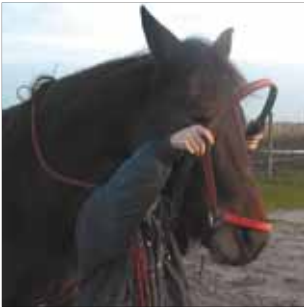
Fig. 3 ~ Vestizione della cavezza