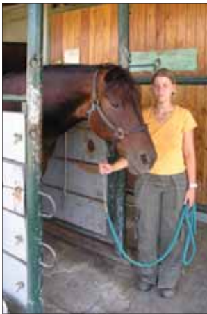
Fig. 21 ~ Fermare il cavallo