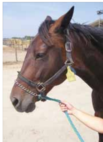
Fig. 7 ~ Catena della lunghina passata sul naso del cavallo