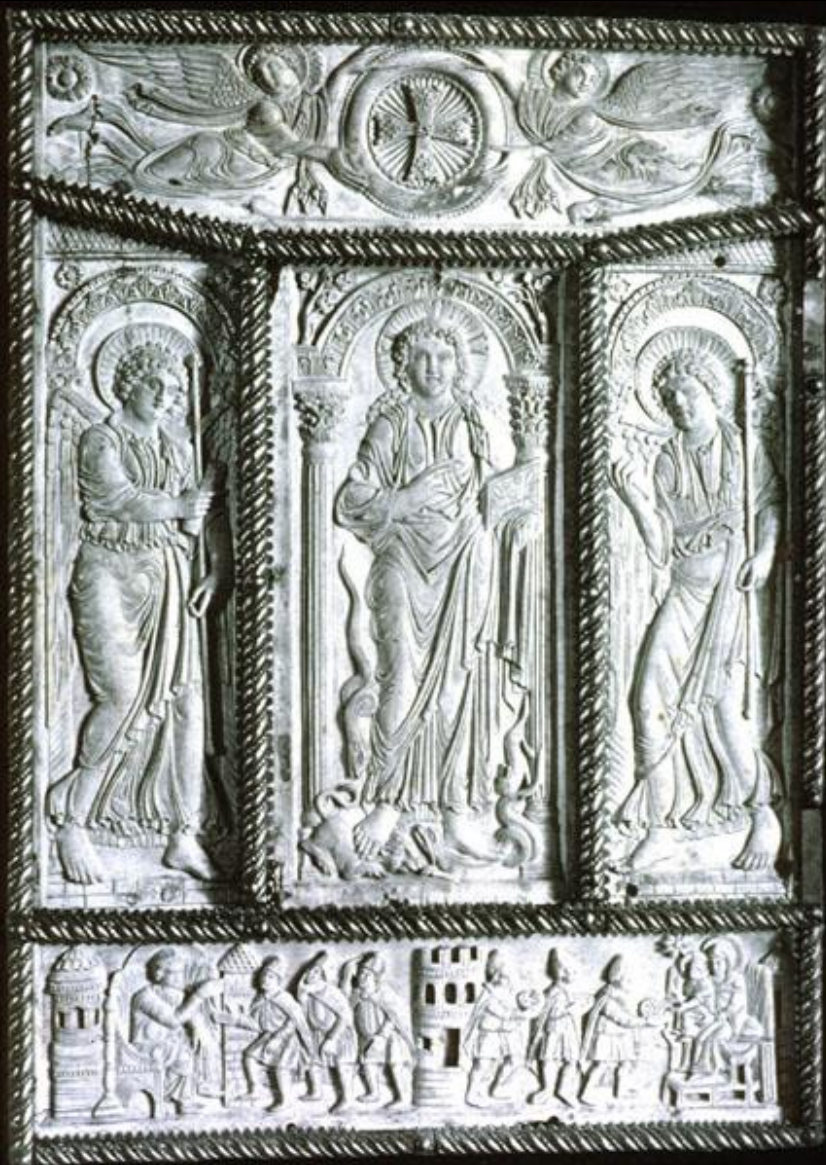
Piatto di legatura dei Vangeli di Lorsch, Germania, ca. 830 (Londra, VAM)