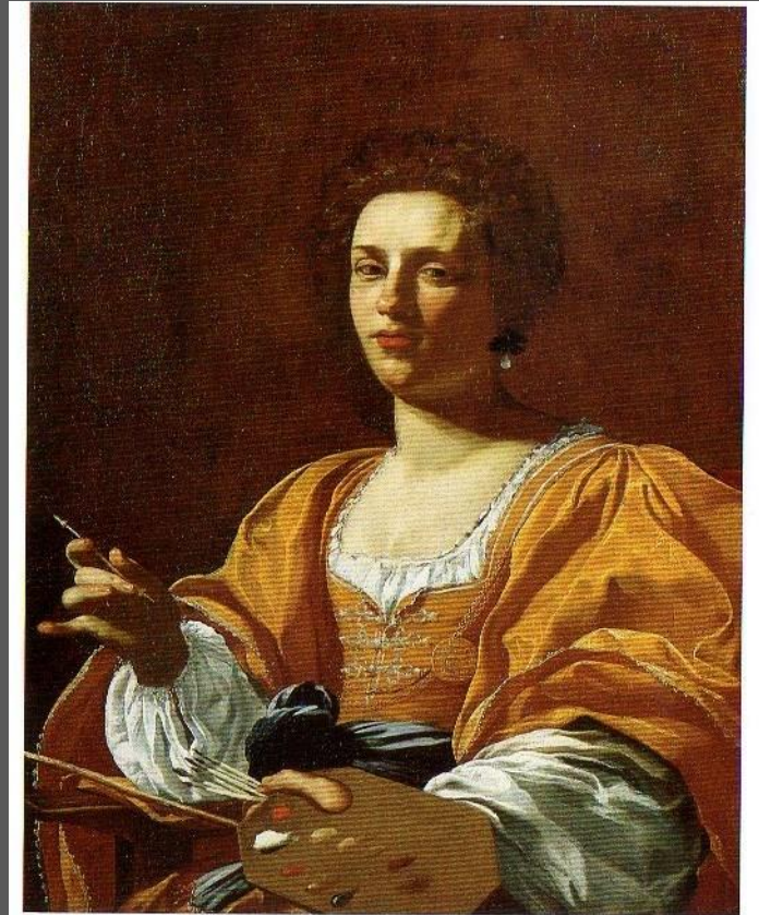
Fig. 5. Simon Vouet, Ritratto di Artemisia Gentileschi , collezione privata.