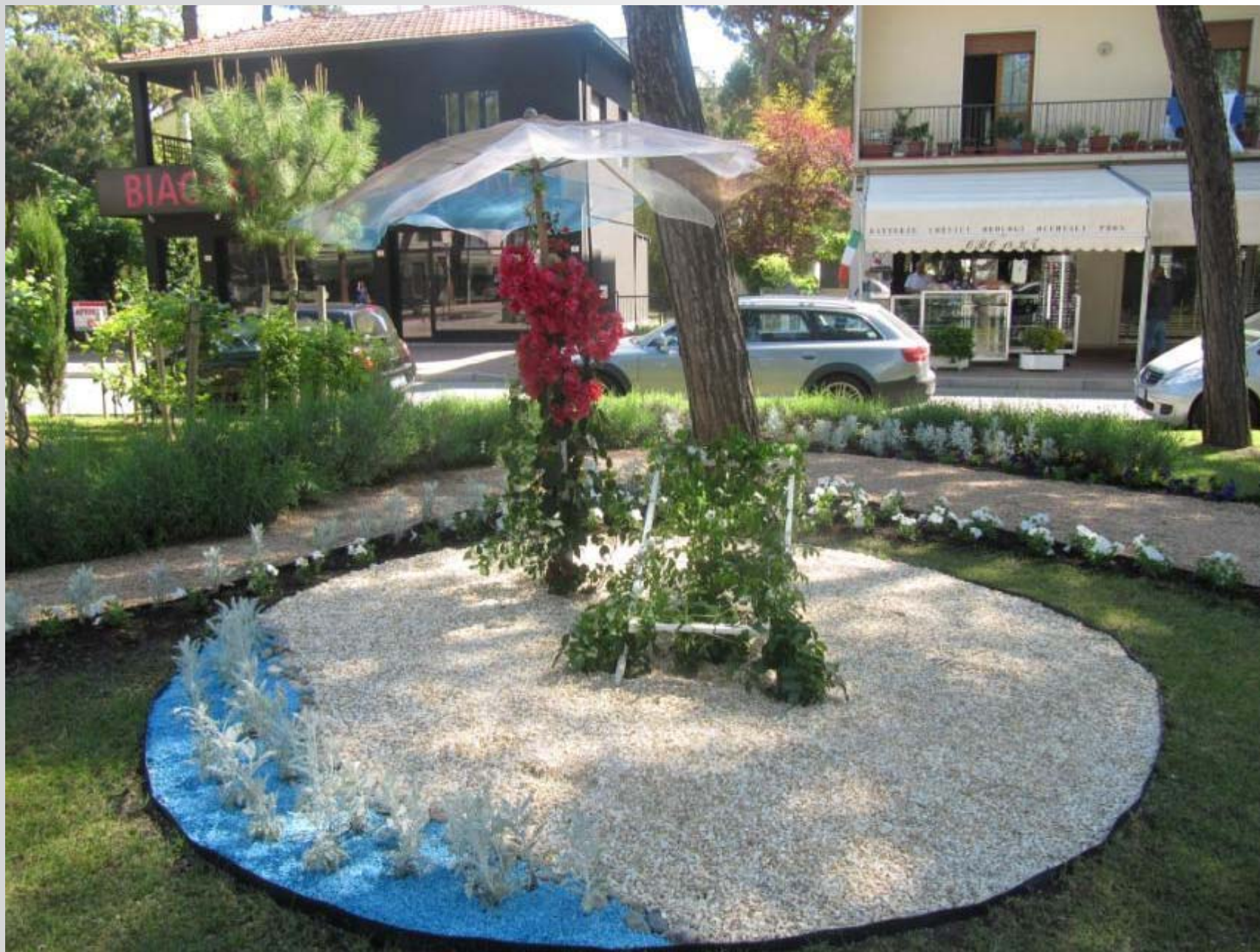
Aiuola realizzata dall'Università di Pisa per il centenario di Milano Marittima