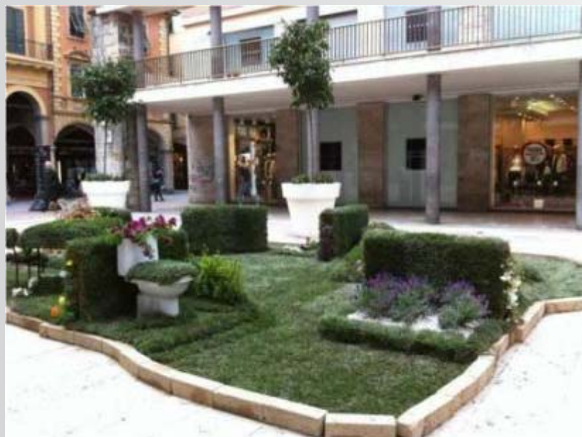
La Rivincita del Verde.....