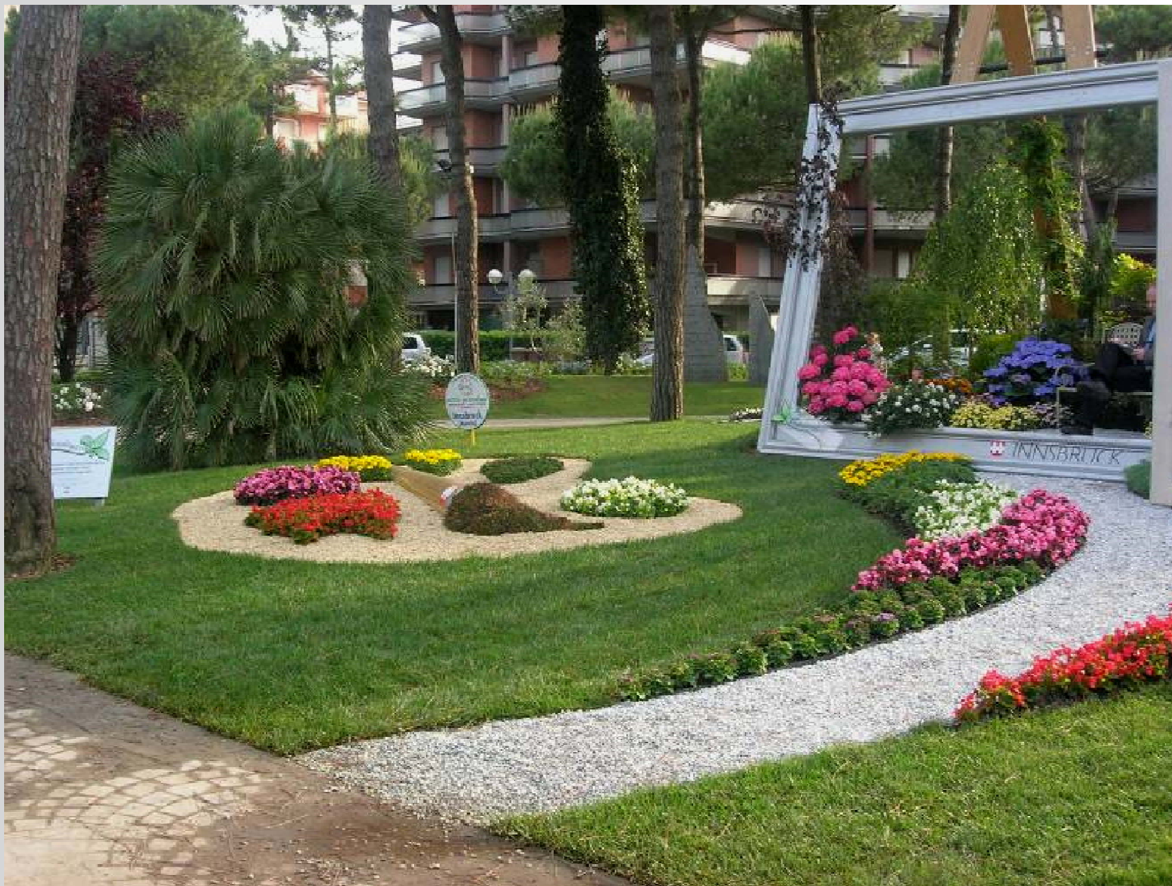
Aiuola realizzata dalla città di Innsbruck (Austria)