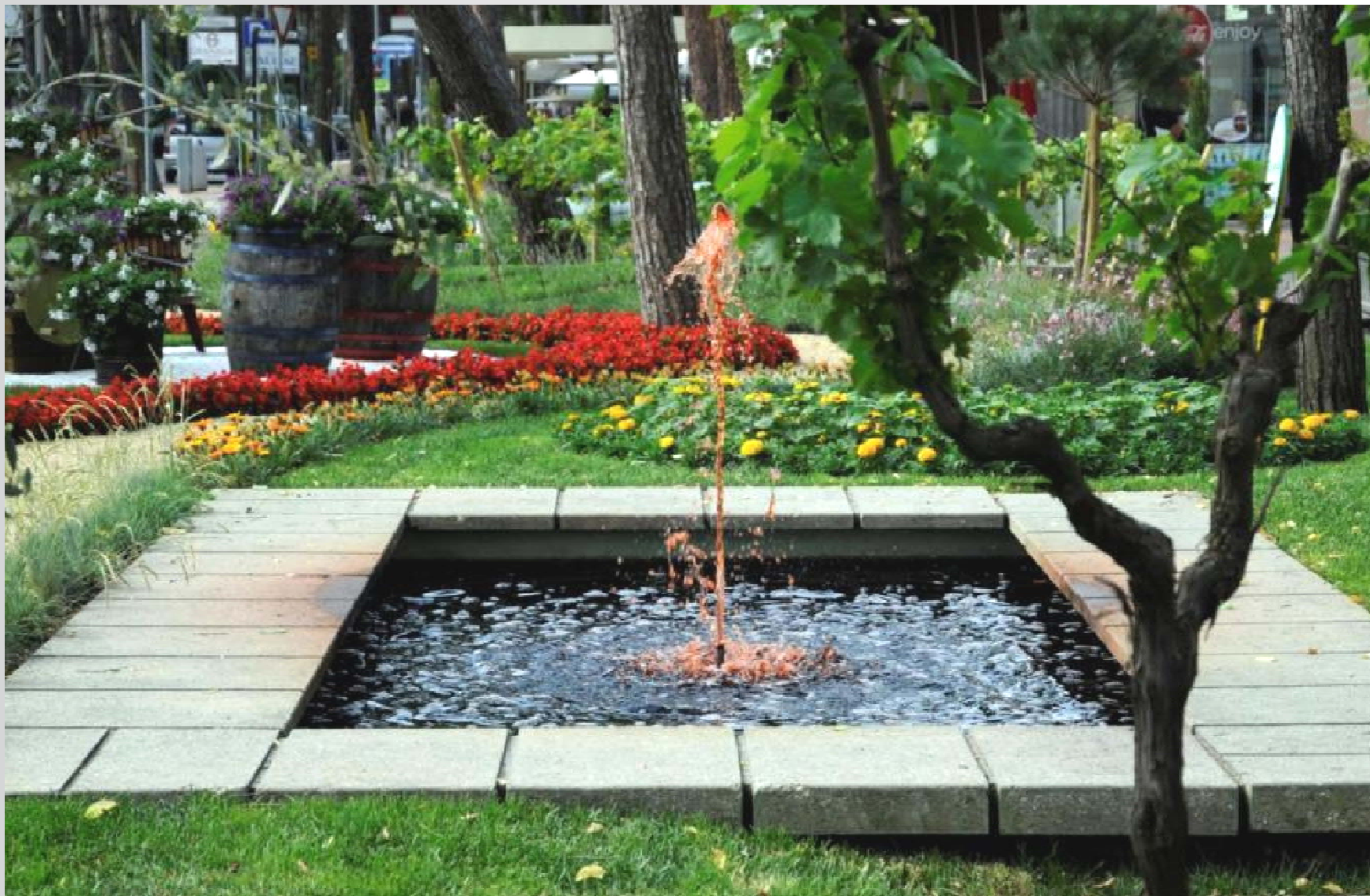
Al centro dell'aiuola zampilla di una "fontana di vino".....