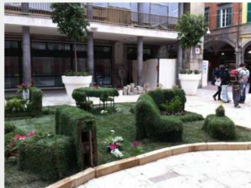
Pisa in Fiore 2012 Largo Ciro Menotti