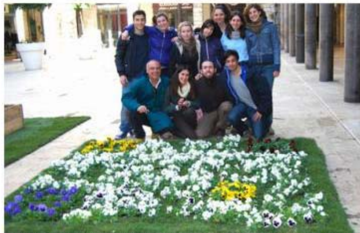
Gli studenti in posa accanto all'allestimento floreale rappresentante il QR code, in occasione della manifestazione "Fior di Città" svoltasi a Pisa.

La novità del progetto consiste nel fatto che si tratta del primo QR realizzato interamente con materiali vegetali, senza l'ausilio di ghiaia colorata o sabbie. "Abbiamo scelto di dargli un tocco di colore per sfruttare al meglio la bellezza dei fiori che lo costituiscono", riferiscono gli studenti.