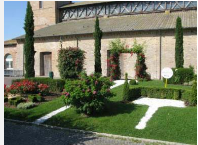
Aiuola realizzata dalla città di Roma