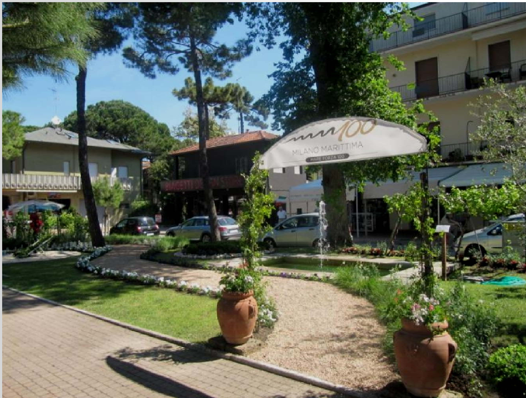
Aiuola realizzata dall'Università di Pisa per il centenario di Milano Marittima