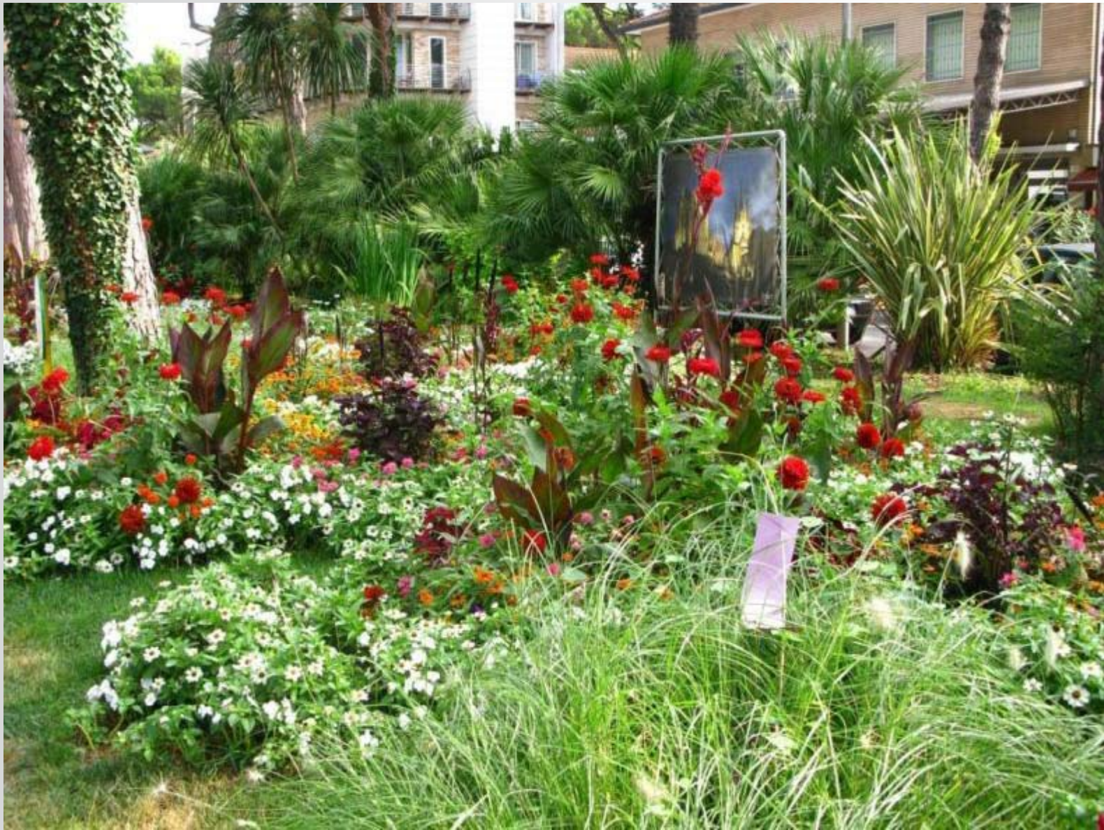
Aiuola realizzata dalla città di Erfurt (Germania)