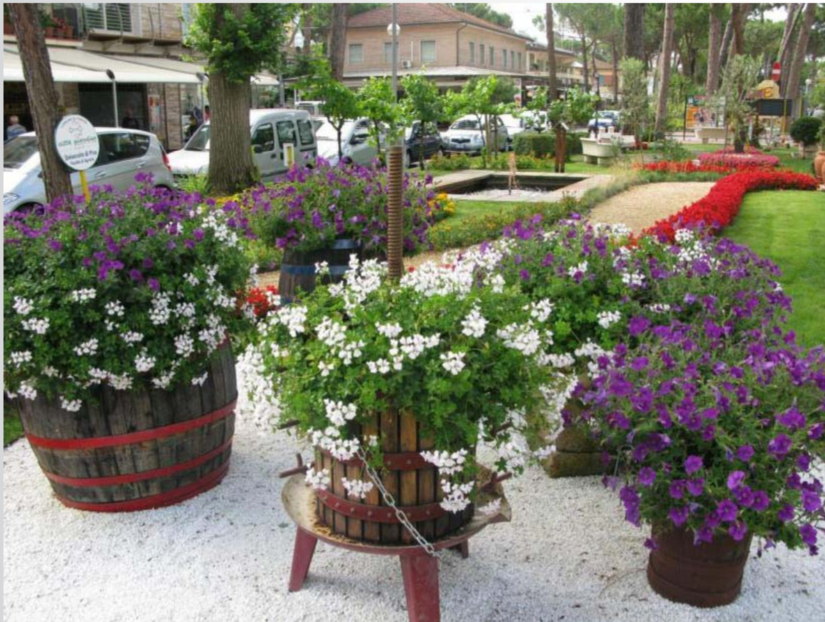
La cultura del vino, molto sviluppata in Toscana, è richiamata dagli attrezzi di cantina, ornati da fioriture