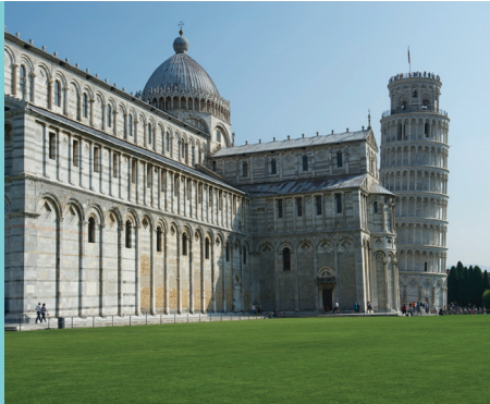
La Torre di Pisa